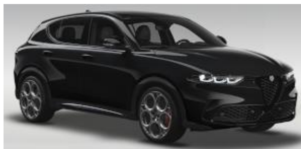
6FX (601) - Nero Alfa