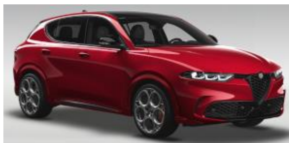
6Y2 (956/C) - Rosso Alfa cu plafon negru