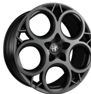
1M5 R20 standard Tributo optional Sprint si Veloce