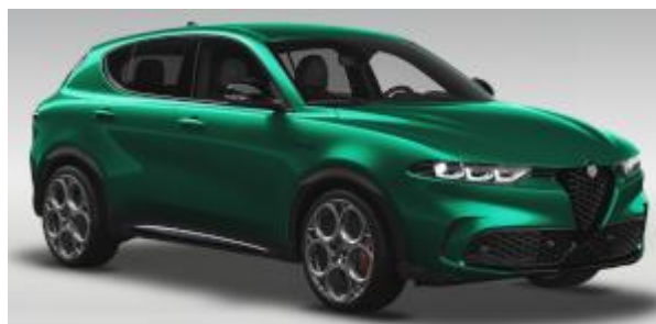
6FW (398/D) - Verde Montreal