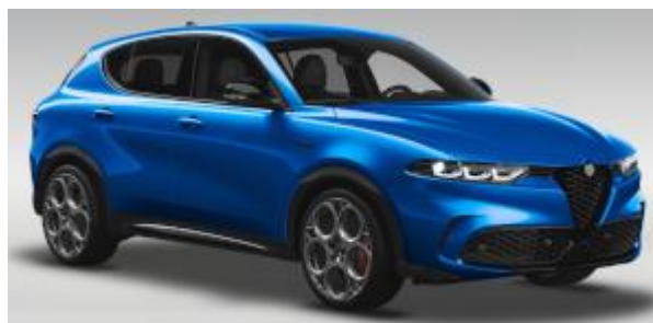
3YS (756/A) - Blu Misano