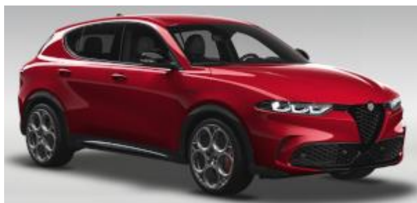
1WY (414/C) - Rosso Alfa