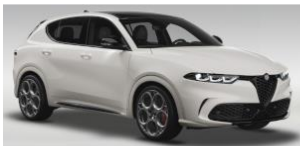
0UX (222/C) - Bianco Alfa cu plafon negru