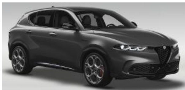
3XV (581) - Grigio Vesuvio