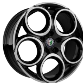
WBR R18 standard Sprint