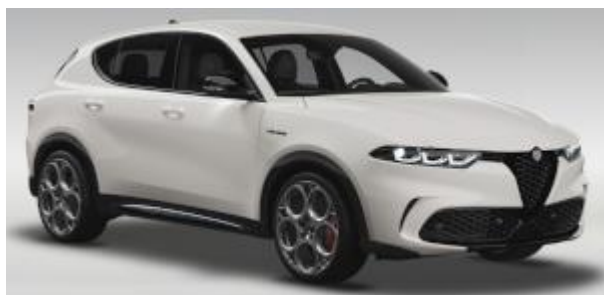
2H6 (240/C) - Bianco Alfa