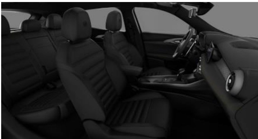
095 – Piele perforata de culoare neagra si cusatura bej (standard Veloce / optional Sprint B1F)