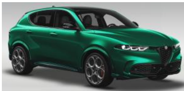
6Y3 (041/B) - Verde Montreal cu plafon negru