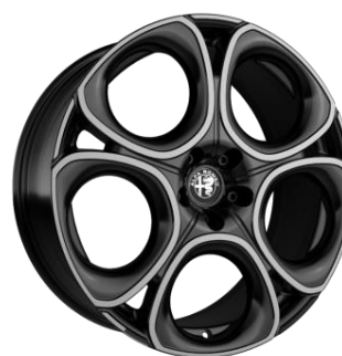
1MD R20 – Standard Edizione Speciale 160 CP