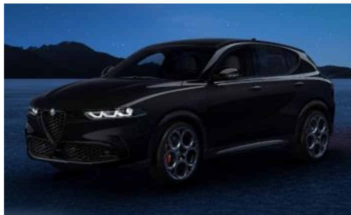
6FX (601) - Nero Alfa