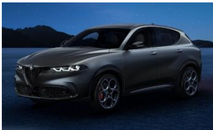
3XV (581) - Grigio Vesuvio