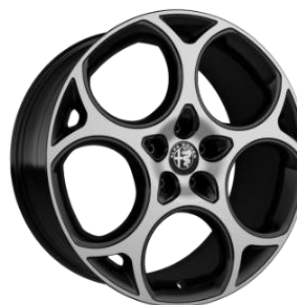
1MM R19 – Standard Veloce Optional Sprint / Ti / Edizione Speciale