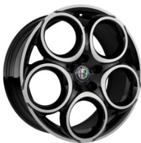
WBR R18 – Standard Ti