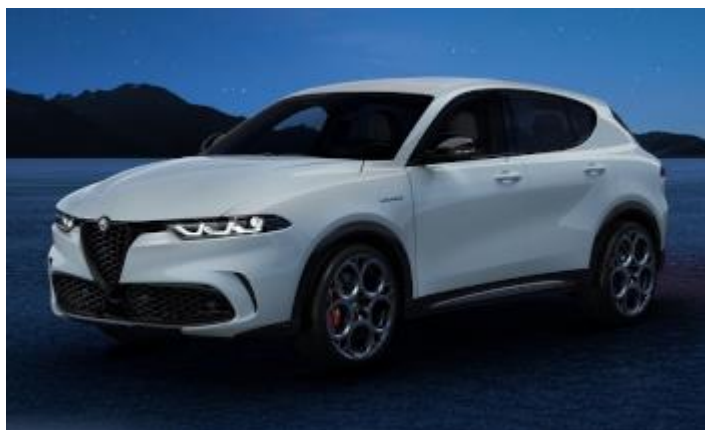
1WX (217/B) - Bianco Alfa