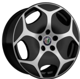
WAC R17 – Optional Super / Ti