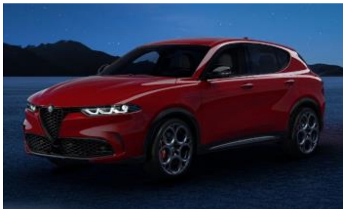
1WY (414/C) - Rosso Alfa