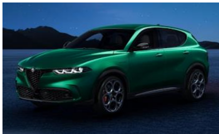
6FW (398/D) - Verde Montreal