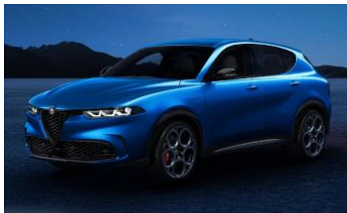
3YS (756/A) - Blu Misano