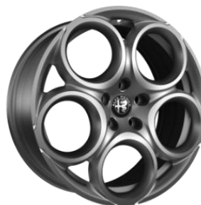
1MA R18 – Standard Super / Sprint