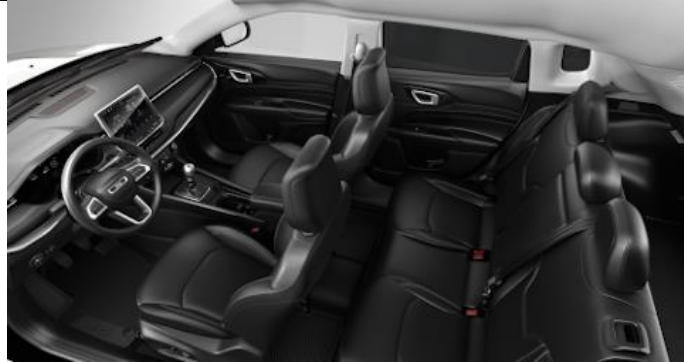
422 - Leather black with diesel grey stitching / Limited