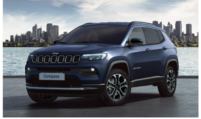
5XZ - Vopsea metalizata Blue Shade