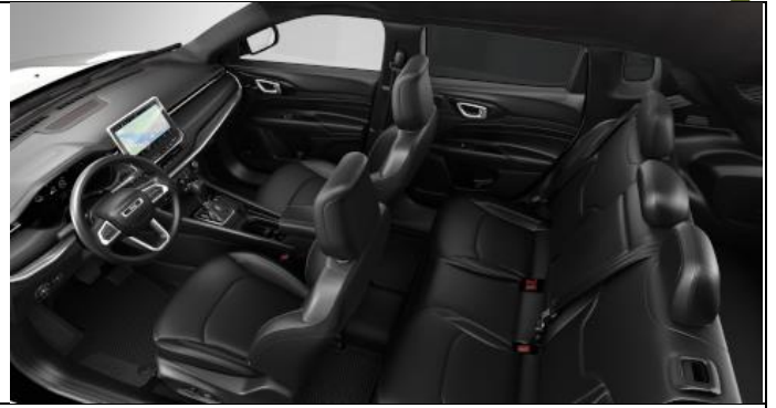
557 - Leather black with diesel grey stitching – ventilated / S