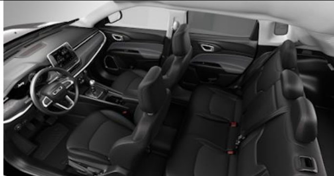
006 - Cloth black with blue stitching / Longitude