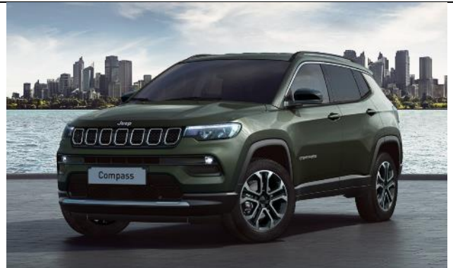
61Q - Vopsea metalizata Techno Green