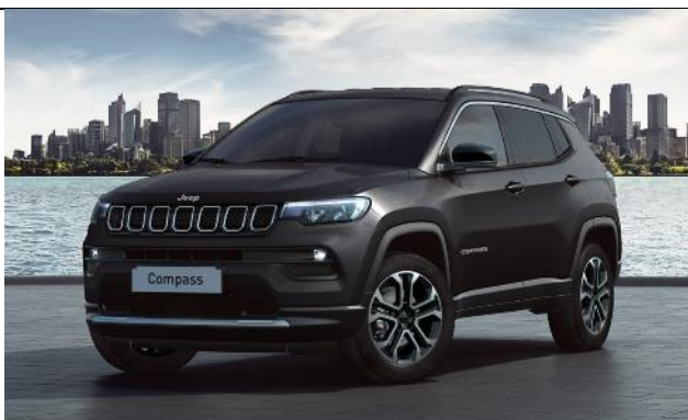
5CE - Vopsea metalizata Carbon Black