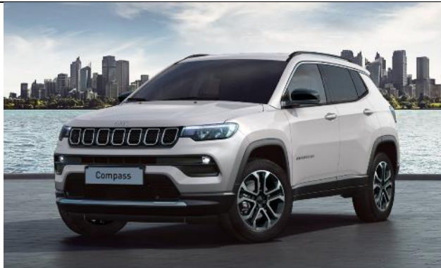
5CA - Vopsea pastel Alpine White