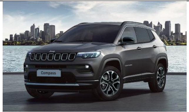
5DT - Vopsea metalizata Graphite Gray