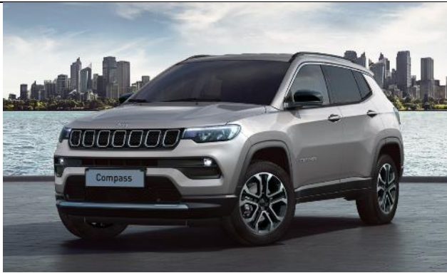
5DN - Vopsea metalizata Glacier