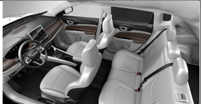
416 - Leather ski grey with diesel grey stitching / Limited