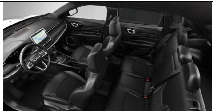
070 - Cloth/ vinyl black with light tungsten stitching / 80 th Anniversary