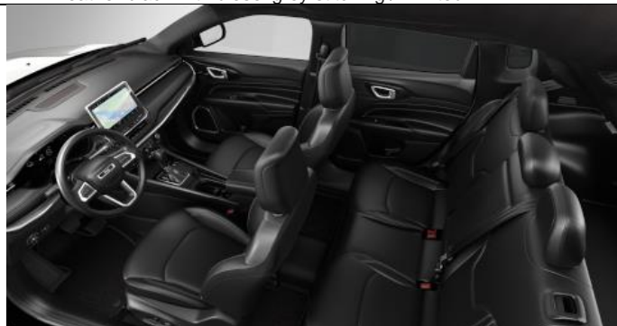
051 - Leather black with light tungsten stitching / 80 th Anniversary