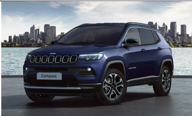
5DP - Vopsea metalizata Jetset Blue