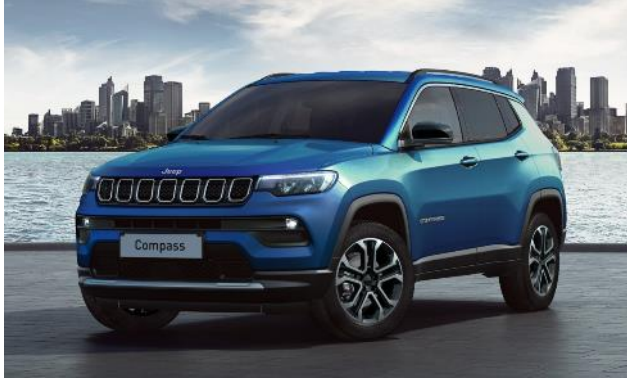
5CH - Vopsea metalizata Blu Italia