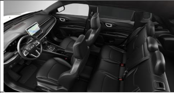
422 - Leather black with diesel grey stitching / S