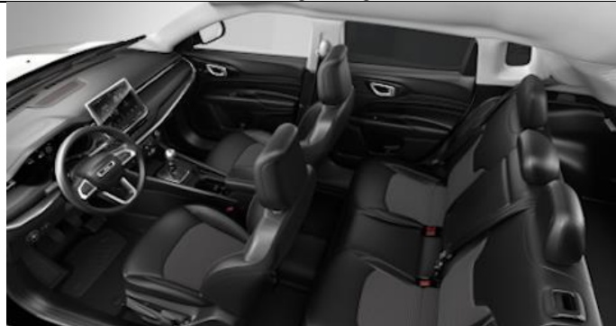
020 - Cloth/ vinyl black with diesel grey stitching / Limited