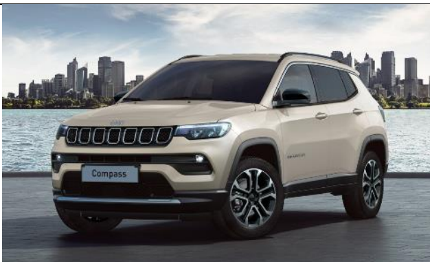
6FX - Vopsea tri-strat Ivory